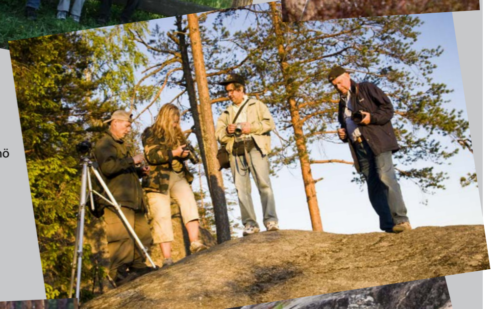
Alarivi: Jaala 2009, Ahvenanmaa 2011